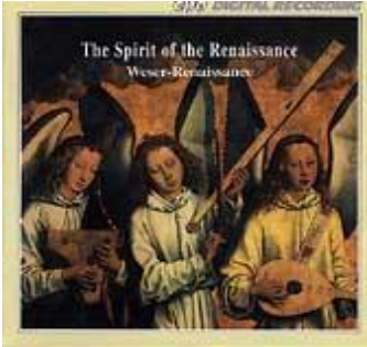
The Spirit of the Renaissance: Musik des 16. Jahrhunderts CD cpo 999 294