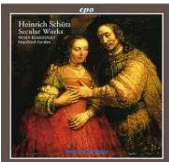
Heinrich Schütz: Weltliche Werke CD cpo 999 518