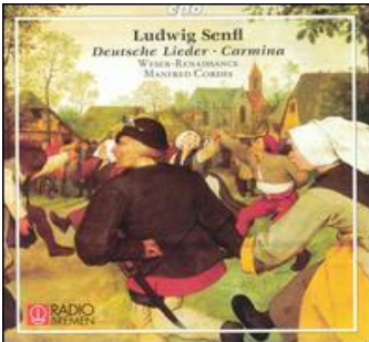
Ludwig Senfl: Deutsche Lieder CD cpo 999 648