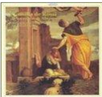
Camilla de Rossi : Il Sacrificio di Abramo CD cpo 999 371