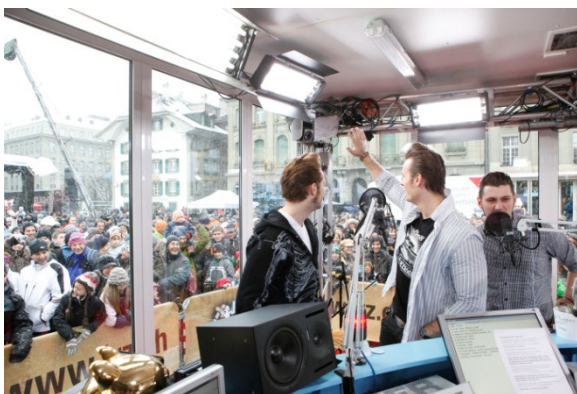
(Il gruppo tedesco The Baseballs)

«Serious Request» è stato lanciato per la prima volta nei Paesi Bassi nel 2004. Da allora il progetto è stato riproposto anche in Belgio, Svezia e Kenya. In Svizzera una colletta è stata organizzata per la prima volta nel 2009 con il titolo «Jeder Rappen zählt» / «Ogni centesimo conta».