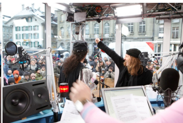
(Chris von Rohr, membro del gruppo Krokus)