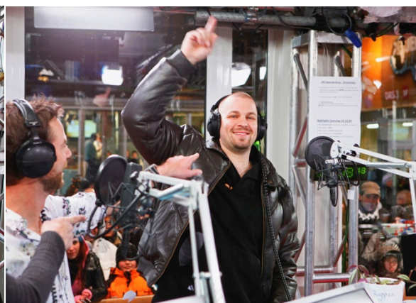
(Stress, rapper svizzero per eccellenza)

L'idea è semplicissima: tre animatori vivono insieme in un cubo di vetro collocato sulla Piazza federale di Berna, accolgono personaggi famosi e raccolgono soldi per una buona causa.