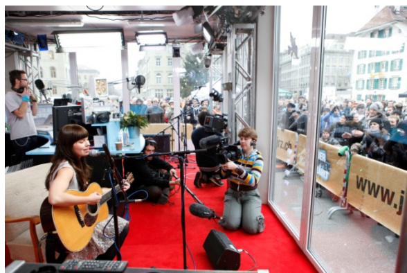
(La cantante norvegese Marit Larson)

La scaletta musicale non è altro che la spina dorsale della colletta: gli ascoltatori hanno infatti la possibilità di acquistare tutti i brani musicali messi in onda durante le 144 ore. Oltre alla musica, ci sono tanti altri modi di incoraggiare una donazione: concerti in esclusiva, aste su internet, doni via SMS, donazioni patrocinate da personaggi in vista o ancora le offerte promosse dal pubblico.