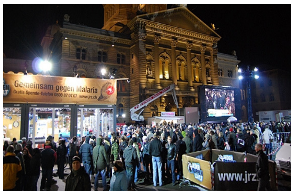
(“Jeder Rappen zählt”, dicembre 2009)