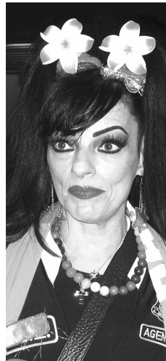
Nina Hagen.

Nina Hagen ist Deutschlands bekannteste Rock-Ikone und ein Phänomen. Ihre Stimme, zwischen Operarie und Punk, beeindruckt mühelos mit einem Umfang von vier Oktaven. Der Film zeigt ihre Anfänge in der ehemaligen DDR und ihren kometenhaften internationalen Aufstieg nach der Ausbürgerung.