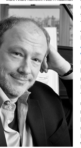
Marc-André Hamelin.

Seine Väter heissen Liszt oder Rachmaninow. Der kanadische Pianist Marc-André Hamelin steht in der Tradition der komponierenden Virtuosen. Er besitzt den Ruf eines Superpianisten und Alleskönners. Und er hat Humor – zu seiner Etüde mit extrem tiefen Noten schreibt er als Anweisung: «Fallen Sie nicht von der Klavierbank.»