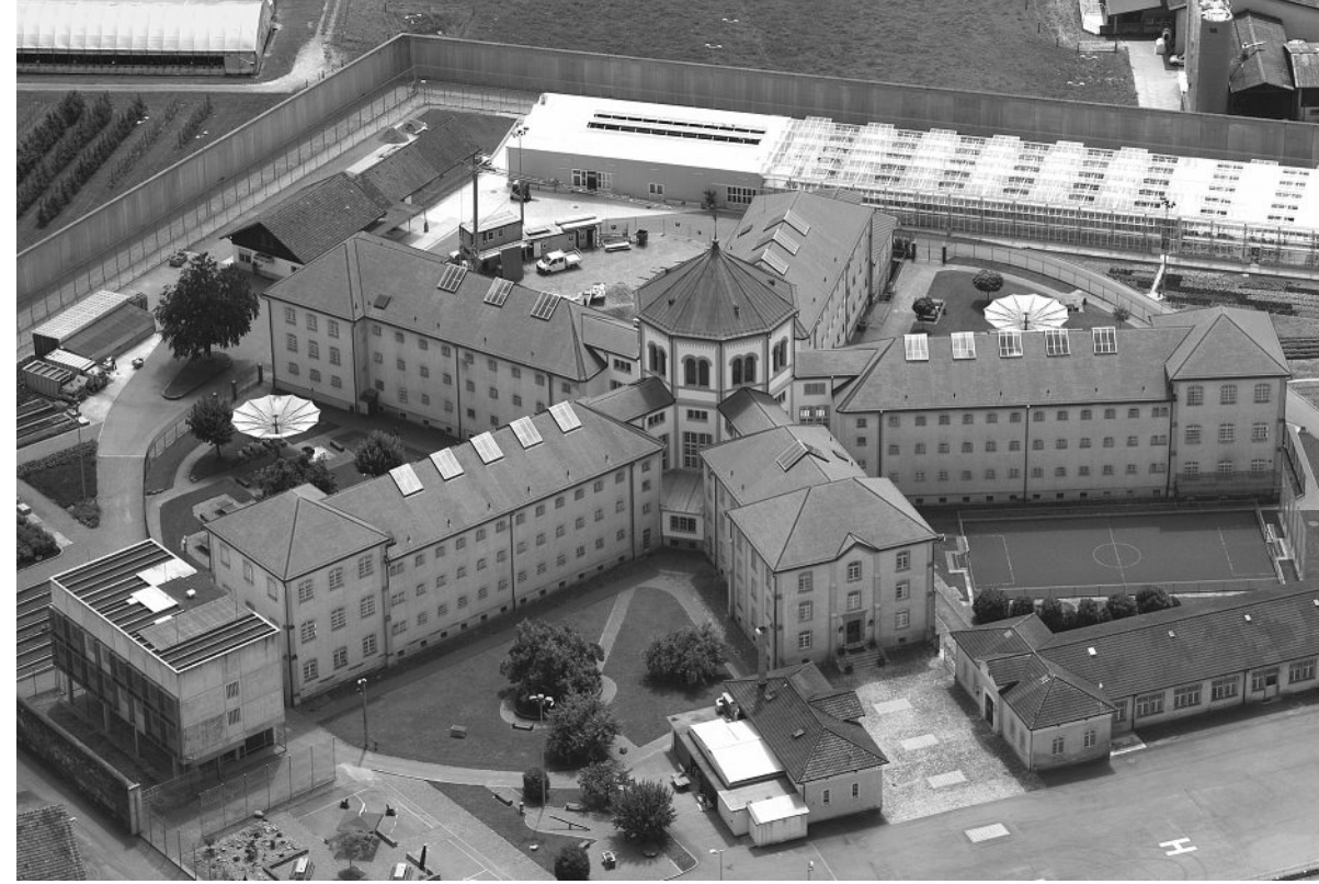
Die Justizvollzugsanstalt Lenzburg wurde im Jahr 1864 als damals architektonisch modernste Strafanstalt Europas eröffnet.

Szenenwechsel in Lenzburg ins Zentrum des ältesten Gefängnisses der Schweiz, ins «Panopticon»: Ein sternförmiger Bau mit einer gläsernen Zentrale, Baujahr 1864.