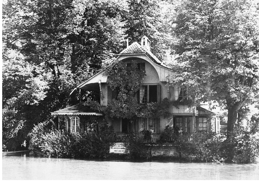
Kleist-Häuschen auf der Aareinsel, 1940 abgebrochen. Das Kleist-Inseli ist heute in Privatbesitz.