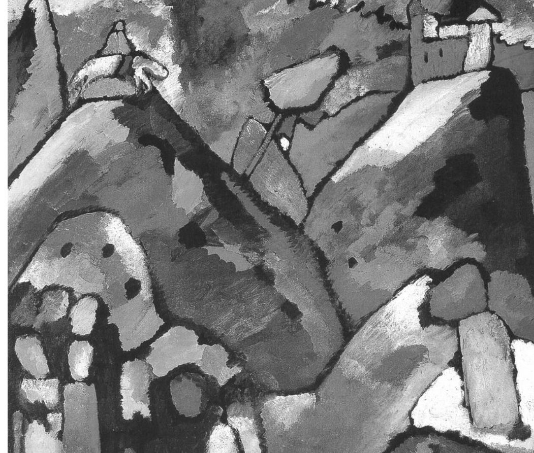
Improvisation 9 von Wassily Kandinsky (1866-1944)

XII. 4'000 Zeichen soll dieser Text haben. Gibt es nicht von Kandinsky Bilder mit dem Titel «Improvisation»? Nehmen wir das Bild noch als improvisiert wahr? Hauptbahnhof, umsteigen.