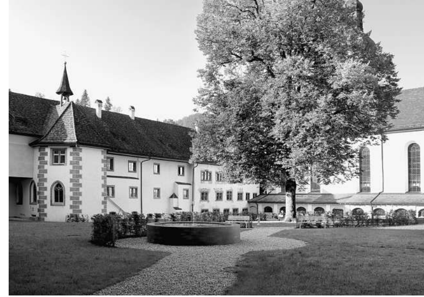
Der Innenhof des 1138 vom Konstanzer Bischof Ulrich II. gegründeten Klosters.

Arbeitstechniken. In einem Lesezirkel wird es anhand von eigenen Texten auch um die Frage der Glaubwürdigkeit, des Selbstbezugs und der Erinnerungsarbeit des Einzelnen gehen. Und natürlich wird da auch von Stil die Rede sein. Im Zentrum der Auseinandersetzung steht aber nie nur der Text, sondern immer auch der Prozess, der vor und mit dem Schreiben beginnt.