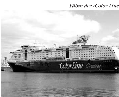
Fähre der «Color Line»

Oslo besticht als «grünste Hauptstadt» Europas und dank seiner einzigartigen Mischung aus unberührter Natur und Grossstadtleben mit einem eigenen Flair. Seit April 2008 wartet die norwegische Kapitale im Hafen mit einem neuen Opernhaus auf: Das einem treibenden Eisberg nachempfundene Gebäude befindet sich direkt am Wasser. Auf seinen teilweise beglehbaren Fassaden bietet sich eine ungewöhnliche Perspektive auf die Stadt und aufs Meer. Die neue Oper ist das grösste norwegische Kulturprojekt der Nachkriegszeit und wurde vom norwegischen Architekturbüro Snøhetta («Schnecke») entworfen, das schon die neue Bibliothek von Alexandria in Ägypten konzipiert hat. Im spektakulären Opernhaus in Oslo werden Sie die Aufführung einer norwegischen Oper und eines Balletts erleben.