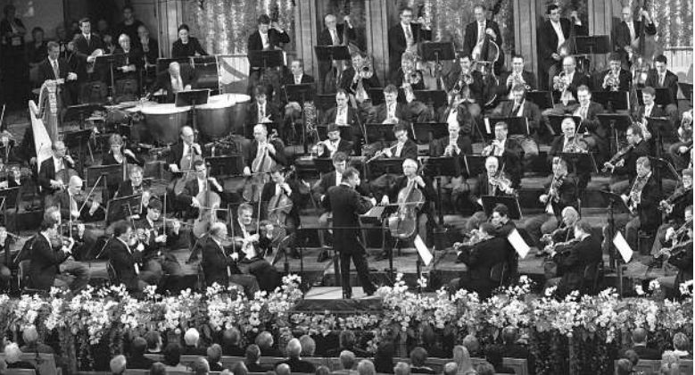
Wiener Philharmoniker unter der Leitung von Mariss Jansons.

Passage2: Stirbt das Tote Meer?! Freitag, 20. Januar, 20–21 Uhr Sonntag, 22. Januar, 15–16 Uhr (W)