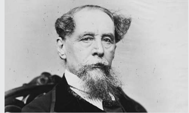
Charles Dickens (1812-1870)