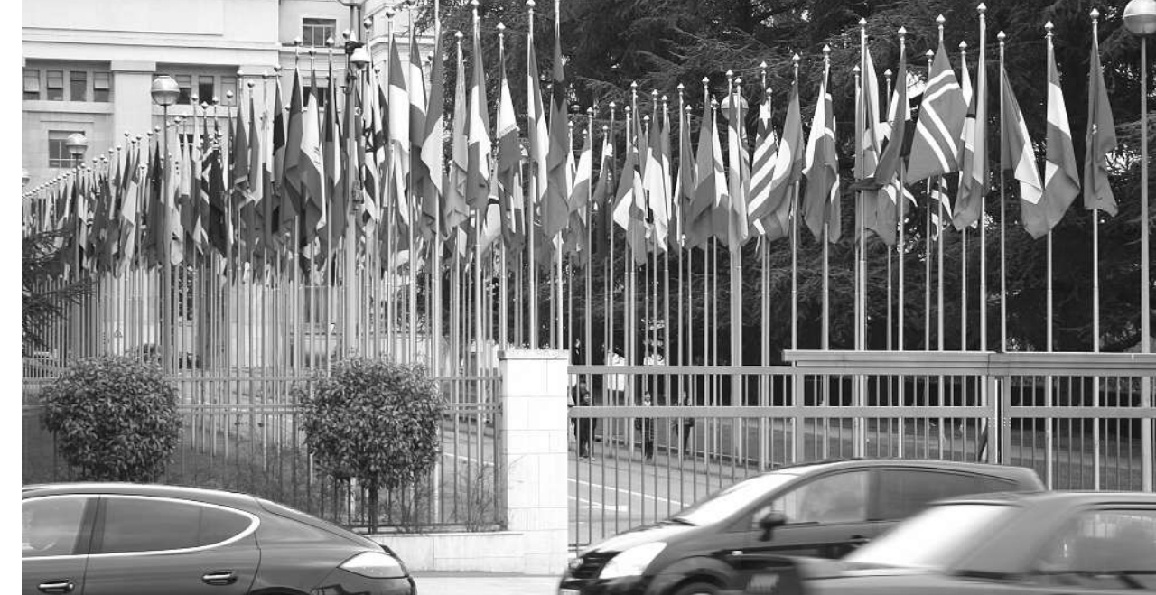
Das Palais des Nations in Genf ist seit 1966 der europäische Hauptsitz der Vereinten Nationen.

Aber noch wird in Genf getagt und getagt. Mehr als 170 staatliche und nichtstaatliche internationale Organisationen residieren hier – vom Weltkirchenrat bis zum Weltpatentamt und dem Weltwetterdienst. Allen Krisenjammer zum Trotz: So mancher Diplomat, in dessen Heimat es kein Wort für Speisekarte gibt, hat bereits tatkräftig recherchiert, warum der «Guide Michelin» Genf so stark mit Sternen gesegnet hat. Fremdenfeindlichkeit kennt man übrigens nicht bei einem Problem, das viele UNO-Unterorganisationen und Auslandsmissionen im Moment stark unter Druck setzt: die enorme Frankenstärke gegenüber Euro und Dollar. Die meisten Auslandsorganisationen erhalten ihr Budget aus Europa oder den USA, müssen ihre Angestellten aber in Franken bezahlen – das könnte sehr wohl ein Grund für die Abkehr von Genf und damit der Schweiz zu sein.