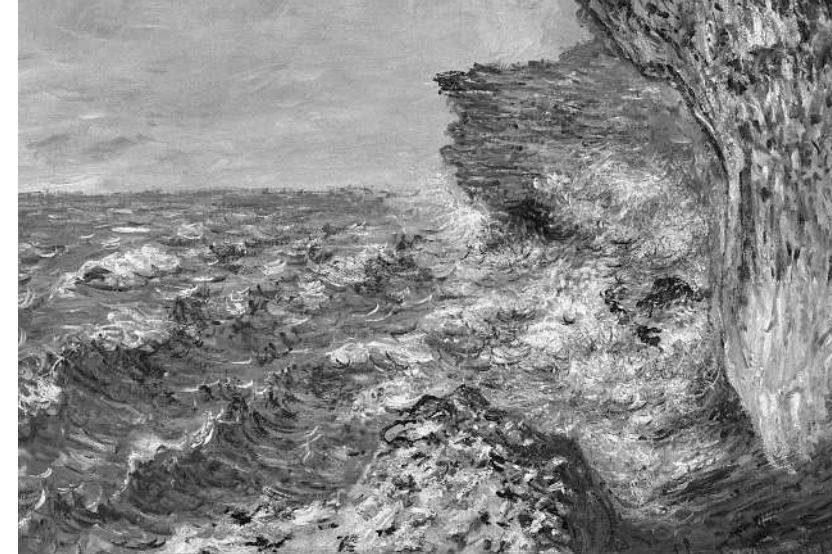
Claude Monet, Das Meer bei Fécamp, 1881, Öl auf Leinwand, 65,5 cm x 82 cm © Staatsgalerie Stuttgart

HÖRBUCH Markus Werner: Klemens Im Roman «Froschnacht» von Markus Werner steht neben der Geschichte des Sohnes auch der starke Monolog des alten Bauern Klemens Thalmann. Er geht im Stall von Kuh zu Kuh, melkt sie und lässt dabei sein Leben Revue passieren. Der alte «Muderer» hadert, schimpft, flucht. Preis für Mitglieder: 1 CD, CHF 15.90 (statt CHF 19.90)