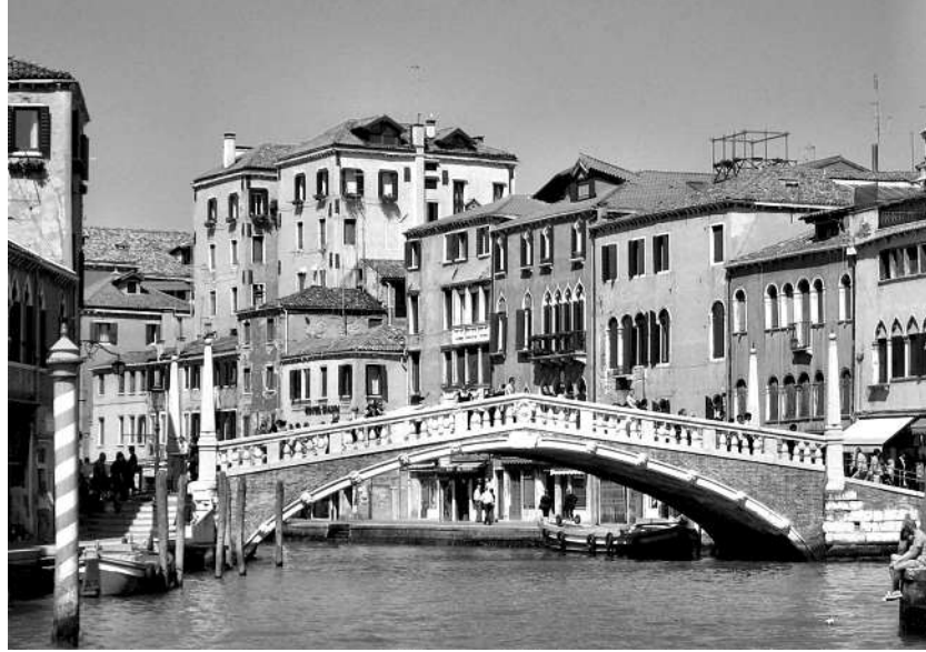
Venedig und seine Lagune stehen seit 1987 auf der UNESCO-Liste des Weltkulturerbes.