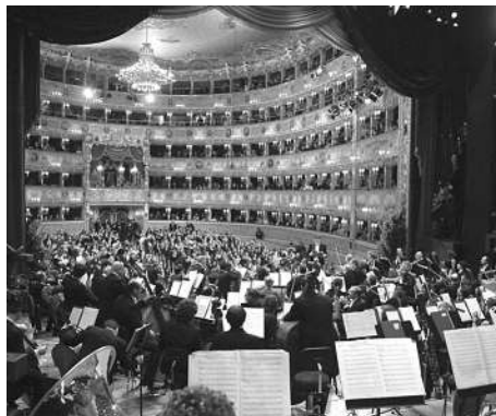
Teatro La Fenice.

Preis pro Person: CHF 2'825.- (im Doppelzimmer)